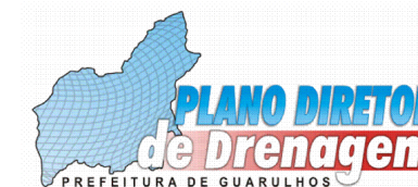
Mapa: 2.4.1.B.: PRINCIPAIS POÇOS TUBULARES CADASTRADOS EM GUARULHOS