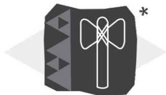
(*) Oxé - Machado de Xangô: Símbolo de justiça na tradição Yorubá

Destacamos abaixo 2 símbolos que representam valores importantes das culturas negra e indígena que foram esquecidos pela história.