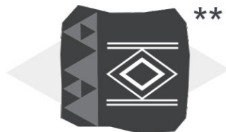
(**) Símbolo indígena que significa “Filhos desta terra”